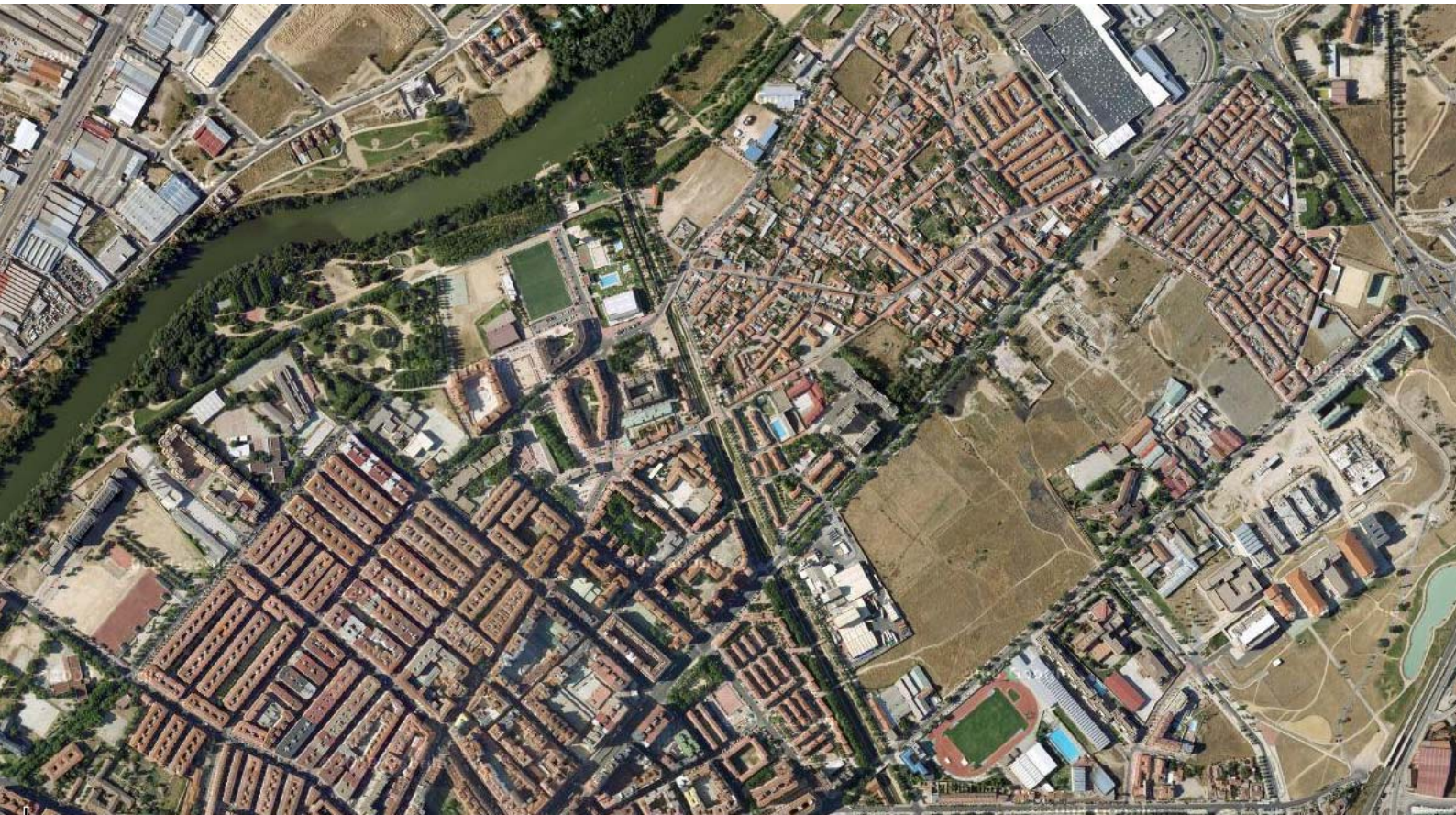
Vista cenital del norte de Valladolid