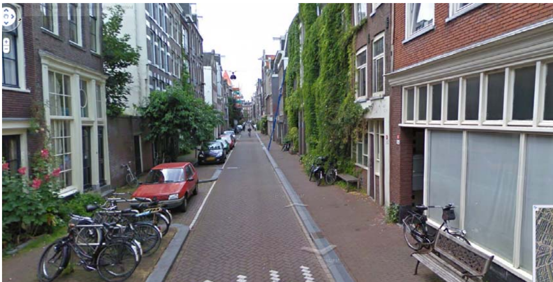
Una calle de Amsterdam (Imagen de Google). Un libro: Les gens de peu , de Pierre Sansot, 2002. Música: Madredeus, As Ilhas dos Açores

La ciudad vivida no se acaba con la correcta definición de los volúmenes o los grandes espacios abiertos. También vive en los detalles del espacio público, de las calles y las plazas.