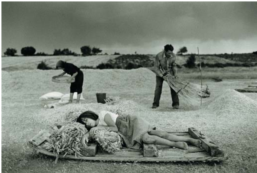
Foto de Cristina García Rodero expuesta en la Sala Municipal de Exposiciones de San Benito de Valladolid en el verano de 2009.

Una película: Master & Commander , de Peter Weir, 2003.