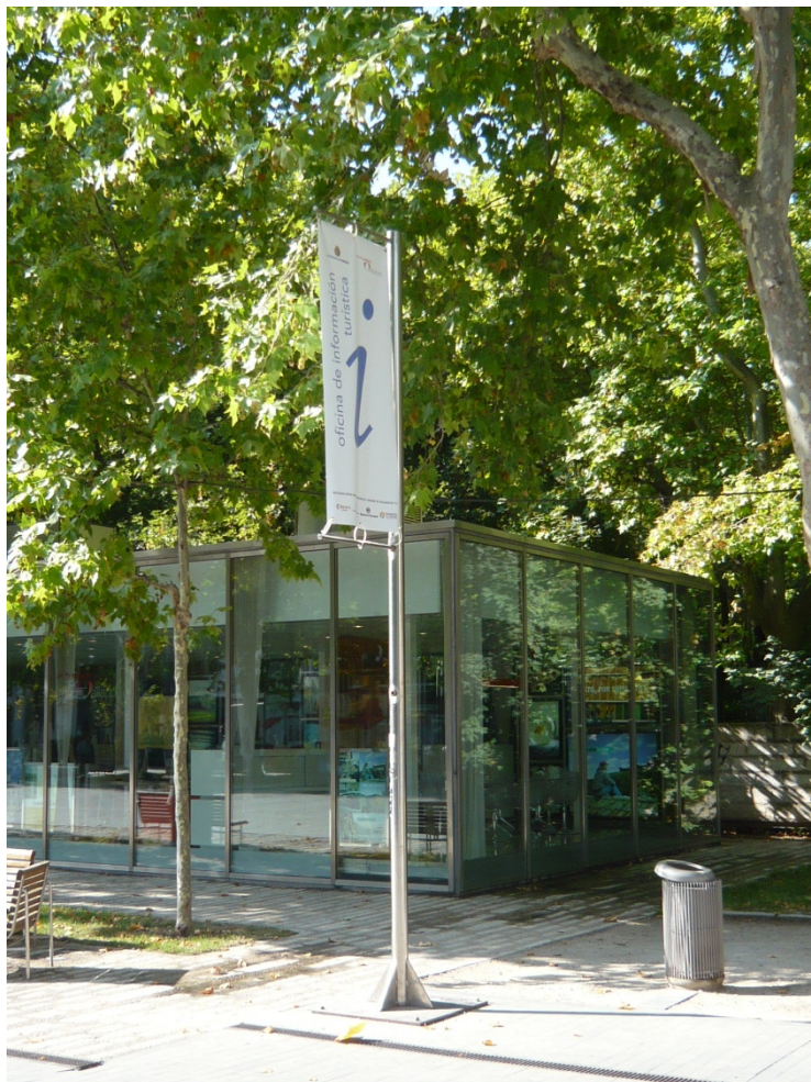
Centro municipal de información de Valladolid.

Película asociada: 14 kilómetros , Gerardo Olivares, 2007. Espiga de oro en la Seminci. Intérpretes: Adoum Moussa, Aminata Kanta.