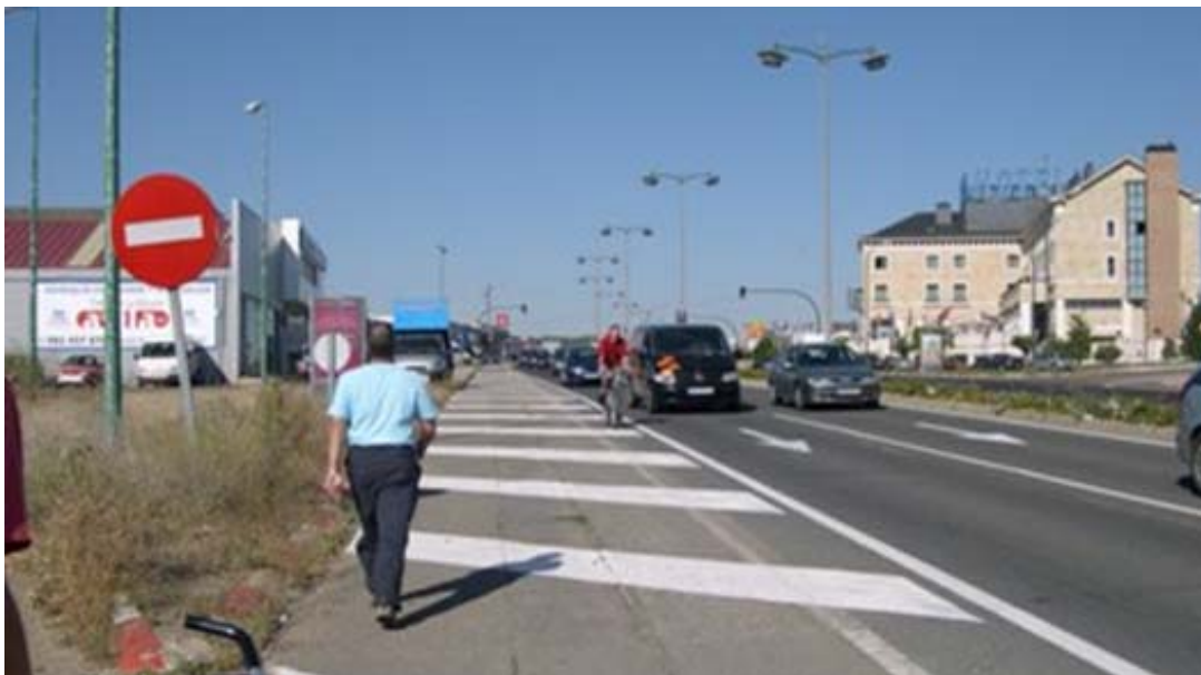
La vieja carretera de Valladolid a León, camino de Zaratán. Una película: Los dioses deben estar locos , de Jamie Uys, 1980. Música: Pablo Milanes, Para vivir

Valladolid forma parte del mundo. Incluso del Alfoz. ¿No sería bueno coordinarse mejor con todas las entidades de mayor rango territorial? ¿No sería bueno tener también más voz internacional?