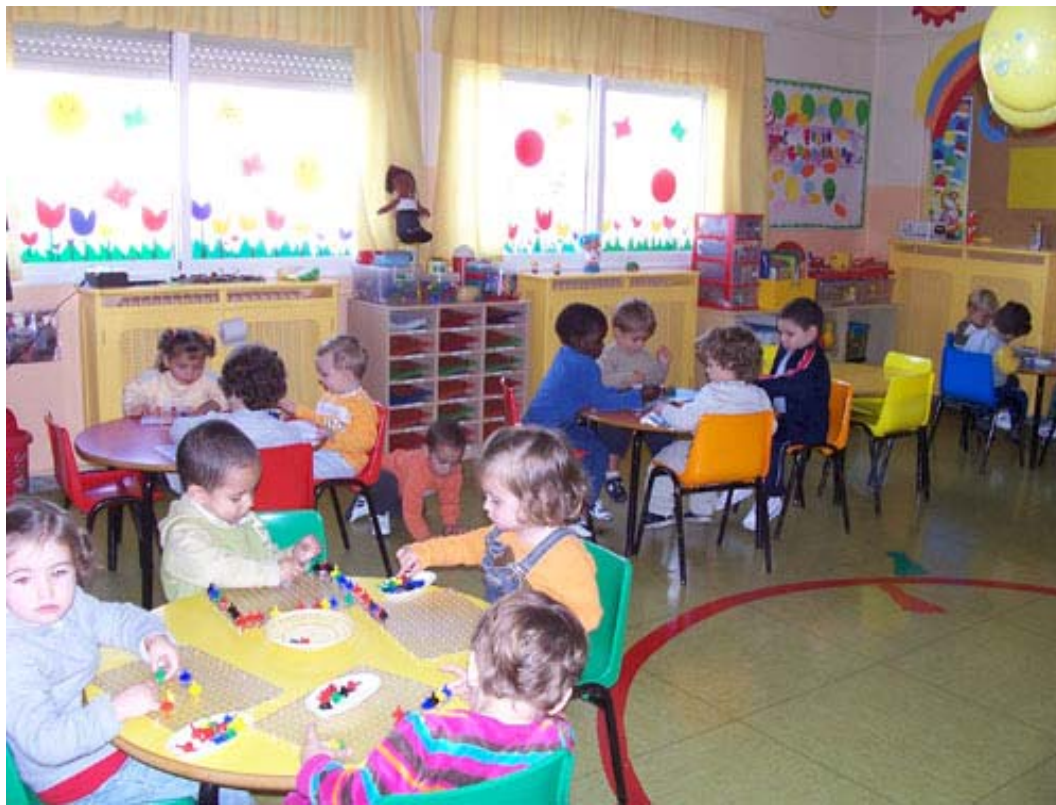
Escuela Infantil El Globo, Barrio España, Valladolid. Libro: Carlo Collodi, Las aventuras de Pinocho (Florencia, 1883). Música: Schumann, Kinderszenen .

Los Ayuntamientos tienen competencias que afectan al bienestar y al desarrollo de los niños. Además, por la proximidad, son los gobiernos locales las instituciones que antes detectan las violaciones de los derechos de la infancia.