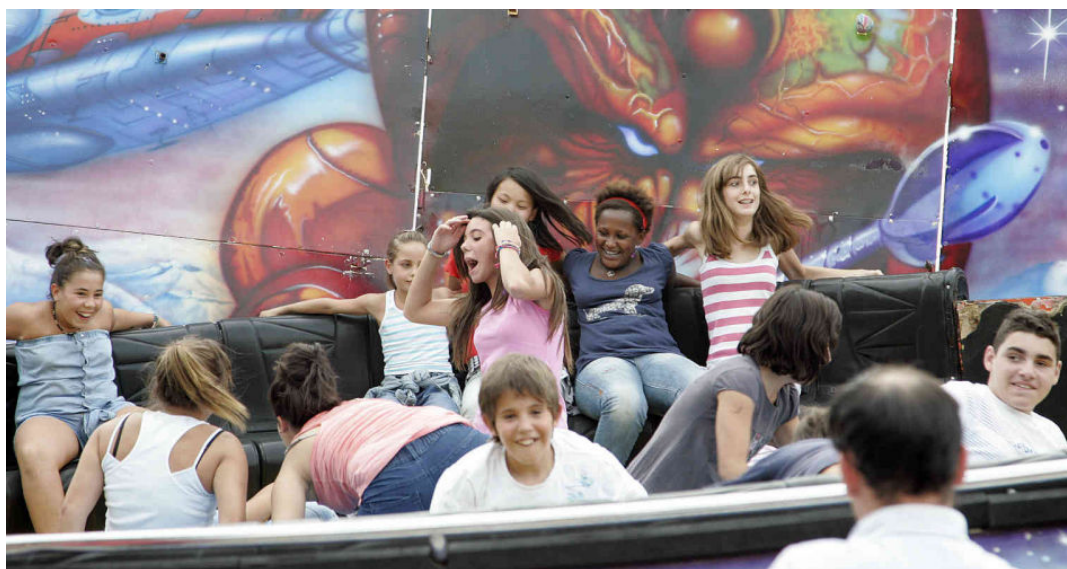
Diversión en una de las atracciones de la Feria. Una película: Senso, de Luchino Visconti. 1954. Música: Más Mozart: Horn Concerto No. 3