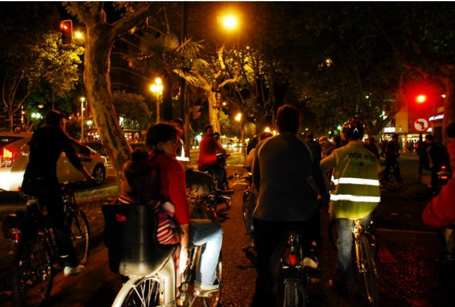
Ciclistas recorriendo Valladolid en la noche.