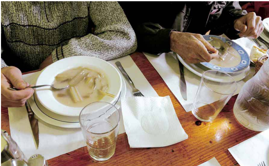
Un comedor social Una película: El rayo verde , de Eric Rohmer, 1986. Música: Arioso Bach

Siempre se habla de mantener las prestaciones sociales. Pero ¿tenemos los ingresos acomodados a las posibles crisis?