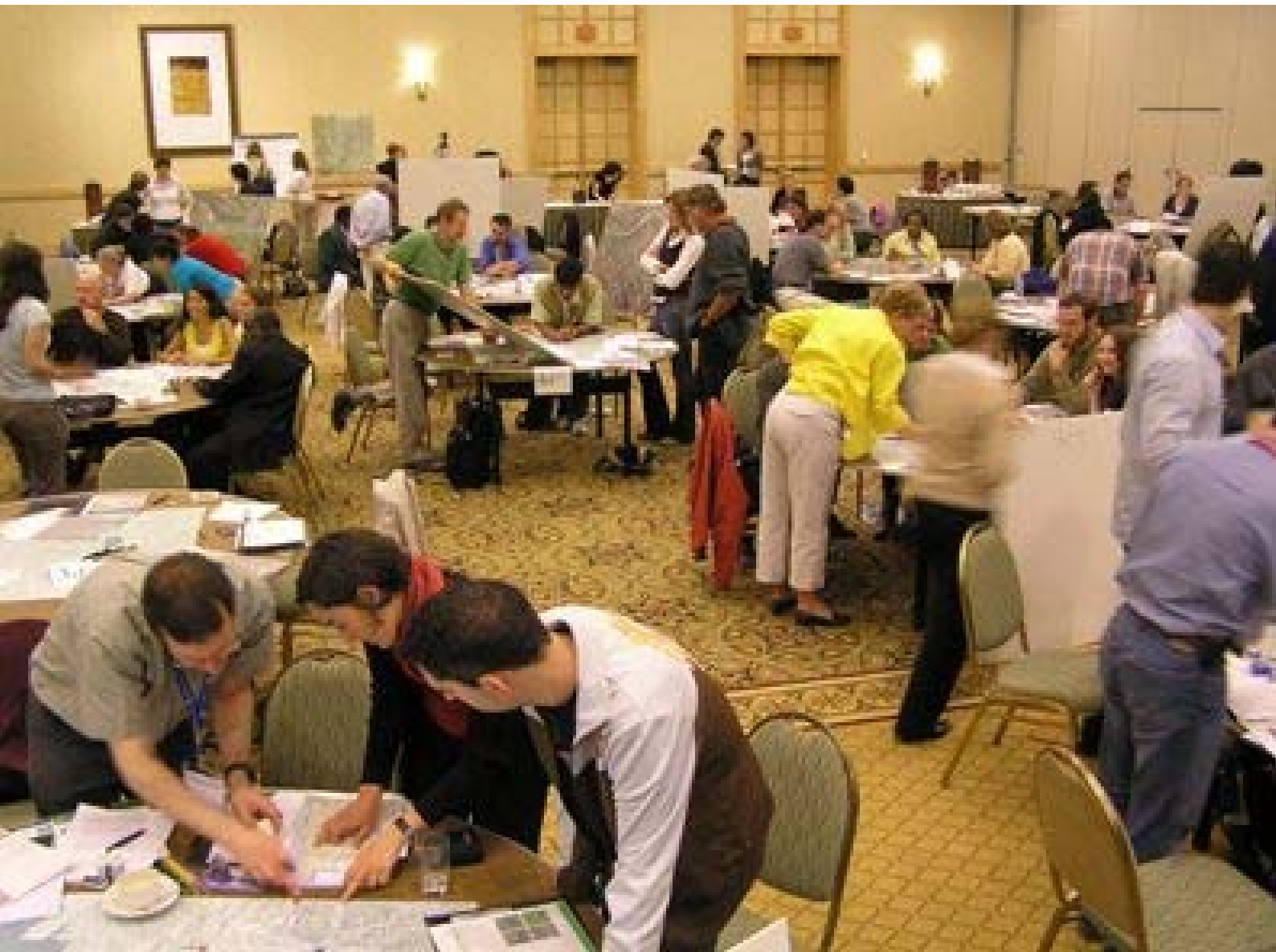
Una reunión vecinal para la participación en Vancouver, Canadá.