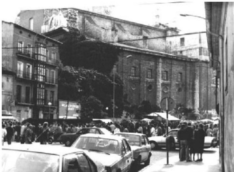
Fotografía antigua de la catedral y una de las casas de la plaza de Portugalete de Valladolid

Una película: Paseo por el amor y la muerte , de J. Huston, 1969.