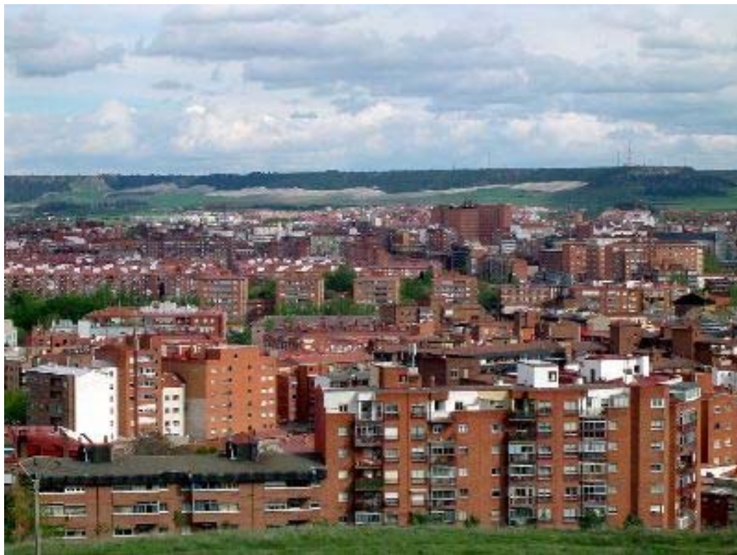
Vista general de Valladolid

Una película: En construcción , de José Luis Guerín, 2001.