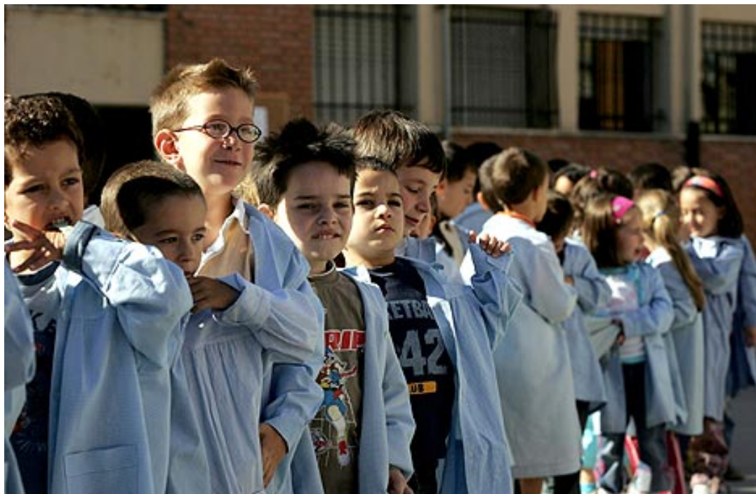
Niños y niñas en el patio del colegio. Una película: Qué bello es vivir, Frank Capra, 1946. Música: Handel, Minuet from Berenice.