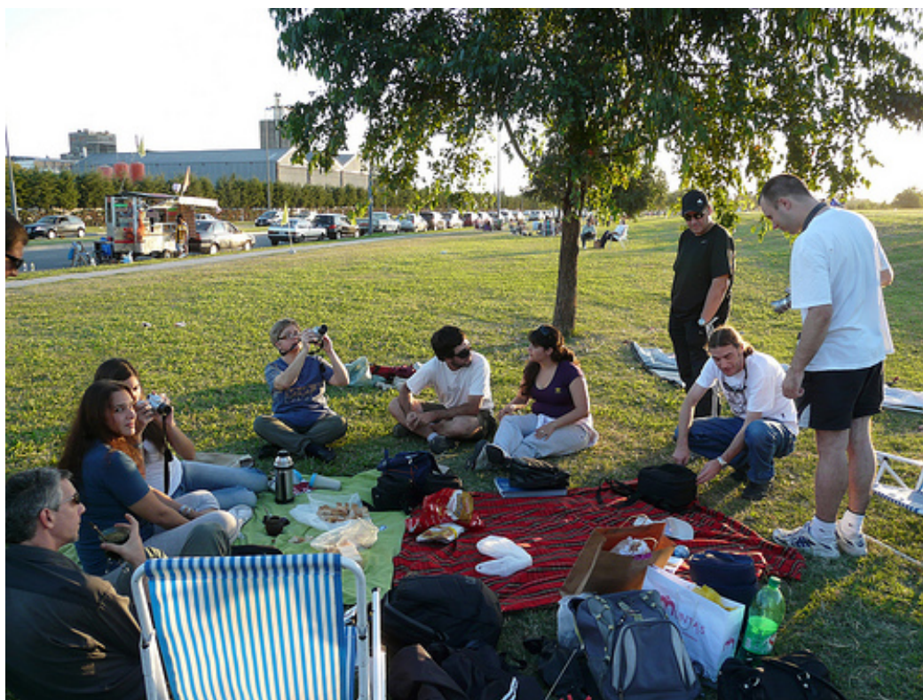
"Tarde de mates en el Escalabrini" (Rosario, Argentina). Un libro: Pasolini, Chavales del arroyo, 1955. Música: Celtas cortos, La senda del tiempo.

¿Qué hacer en el tiempo de ocio? Paseo, lectura, asistir a espectáculos, visitar exposiciones, práctica deportiva... pero todas estas actividades ya se comentan en otros apartados. Vamos a fijarnos, pues, en otras tres posibilidades: Estar con los amigos, crear con los amigos, jugar con los amigos. ¿Qué hace el Ayuntamiento respecto a este tipo de ocio?