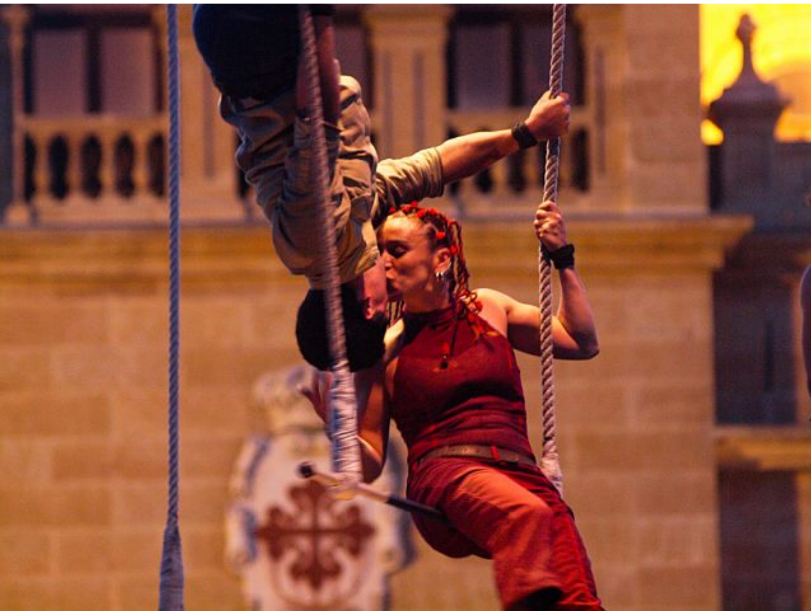
El beso de Spiderman. Actuación de la Compañía de Paso en la Plaza Zorrilla. Teatro de calle, 2 de junio de 2010.