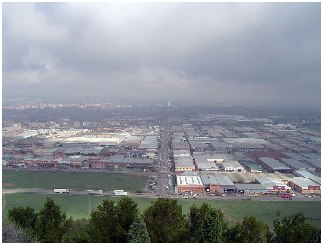
Polígono de San Cristóbal, desde el cerro. Una película: Berlín: sinfonía de una ciudad , de Walter Ruttmann, 1927. Música: Tritsch Tratsch Polka

El sector industrial representa en este momento del orden del 17% del empleo total de la ciudad y de su espacio metropolitano. Se pretende que el peso del sector industrial siga siendo relevante en el futuro y, para ello, se fija como objetivo de mínimos que este porcentaje de empleo no descienda, en el espacio temporal del 2016. (Sin perjuicio del gran peso actual y también futuro del sector servicios). Para que se desarrollen estos factores se deben de encontrar una serie de circunstancias favorables, entre las que se encuentra la Existencia de suelo industrial adecuado a precios competitivos. El sector de servicios representa más del 70% de los que están ocupados de Valladolid y su espacio metropolitano. Se espera que este porcentaje aumente en los próximos años hasta acercarse al 75%. El comercio y la hostelería representan una parte muy importante del empleo de la ciudad (del orden del 20%). El conjunto de actividades del sector servicios correspondientes a Transporte, almacenamiento y comunicaciones, Intermediación financiera y Actividades inmobiliarias y de alquiler servicios empresariales representan en este momento casi un 20% del empleo total. Las posibilidades de crecimiento de estos subsectores de actividad son muy grandes. Valladolid, en relación con otras ciudades, ofrece importantes ventajas competitivas para el desarrollo de este tipo de actividades como: Posición geográfica,