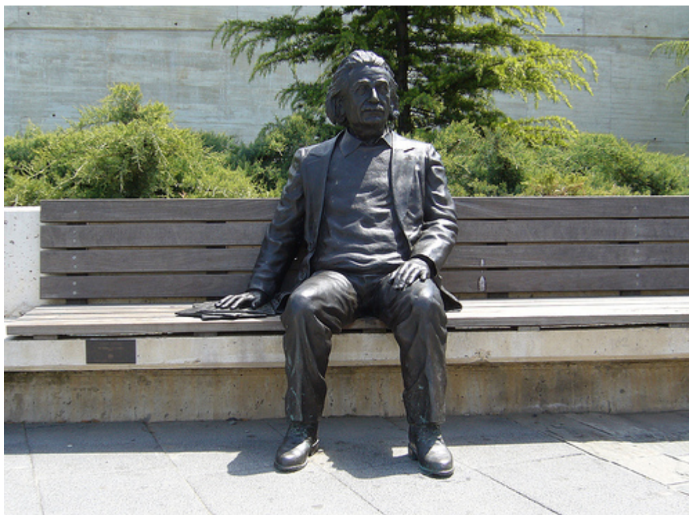
Einstein en el Museo de la Ciencia (citar autor foto). Una película: Nostalghia , de Andrei Tarkovsky, 1983. Música: Medieval castles and ruins with medieval music