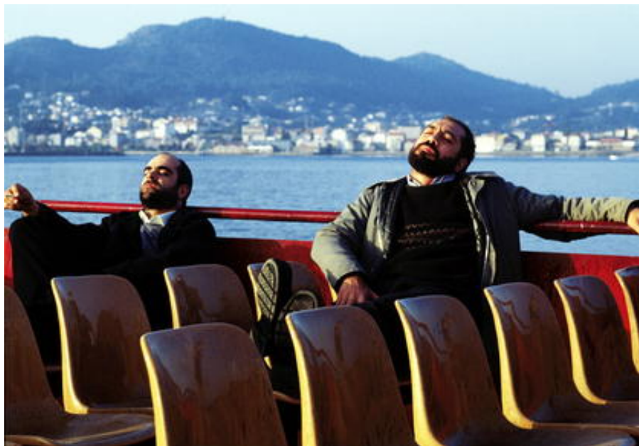
Un fotograma de Los lunes al sol Una película: Arcadia , de Costa-Gavras, 2005. Música: Astor Piazzolla, Libertango .

Entre la gente del vecindario podemos, al menos, acompañarnos. Y no es poco.