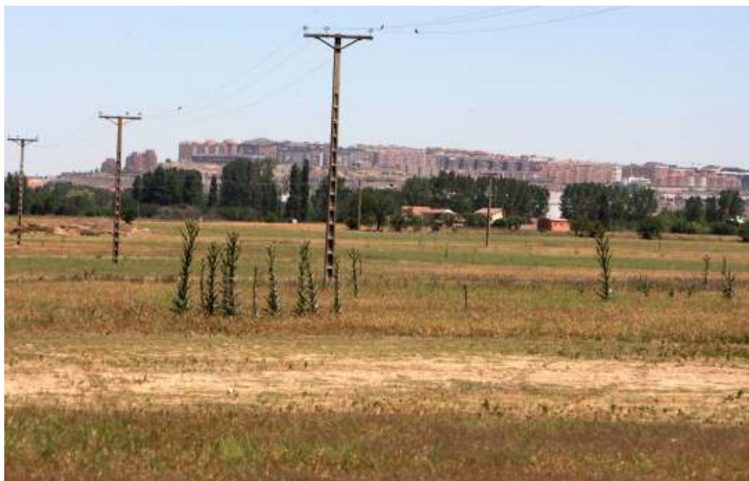
Campos urbanizables (al sur) con la ciudad al fondo. Una película: Manos sobre la ciudad , de Francesco Rosi, 1963. Música: Lole y Manuel, Nuevo Día

¿Cuántos planes, o programas o lo que sea, hay en marcha en la ciudad de Valladolid? ¿Están articulados? ¿Son mínimamente coherentes? En principio serían dos los determinantes: el Plan Estratégico, como visión global de futuro; y el Plan de Acción, como propuestas concretas integradas que organizan el gobierno. ¿Funcionan?