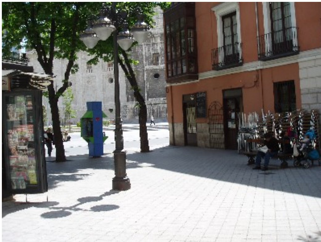
Plazuela de la Libertad. Al fondo, el Penicilino. Una película: Los espigadores y la espigadora , de Agnès Varda, 2000. Música: Haendel, Rinaldo , Aria Lascia chio' pianga