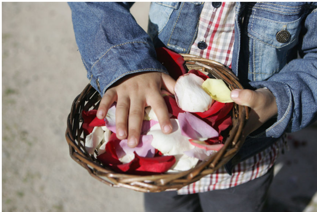
Foto de la Celebración del Día Internacional del Pueblo Gitano en Valladolid, 2010 (Autora: Henar Sastre; procedente de www.nortecastilla.es ).

Un libro: F. García Lorca, Romancero gitano .