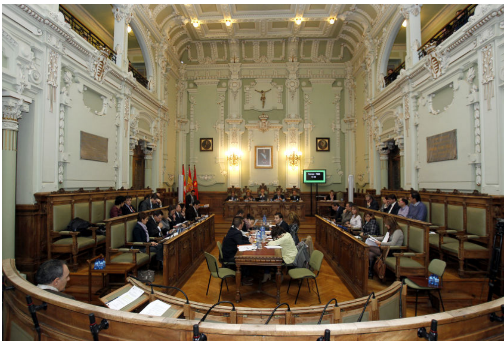
Una imagen del Pleno, Ayuntamiento de Valladolid. Una película: All the King's Men , de Robert Rossen, 1949. Música: The Beatles, All You Need Is Love .

El Alcalde y el Pleno. Estudiemos la estructura política del Ayuntamiento.