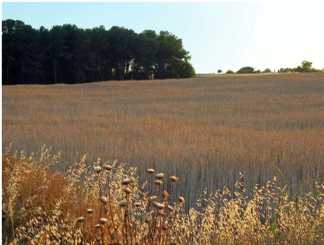
Campos del Alfoz de Valladolid

Una película: El cielo gira , de Mercedes Álvarez, 2004.