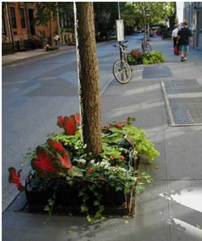
Una calle de Greenwich Village en 2001 Un libro: Eustaquio Barjau, Elogio de la cortesía (Madrid, 2006). Música: Sidney Bechet, Petite Fleur (Olympia Concert Paris, 1954)

Mercedes, ama de casa, se ocupa de un pequeño mundo. Y lo hace intentando conseguir cuatro objetivos: procurando que el espacio resulte agradable, aplicando cuidados poéticos, derrochando lujos posibles y haciéndolo de forma continuada, de manera que la casa parezca en todo momento recién planchada, permanentemente renovada.