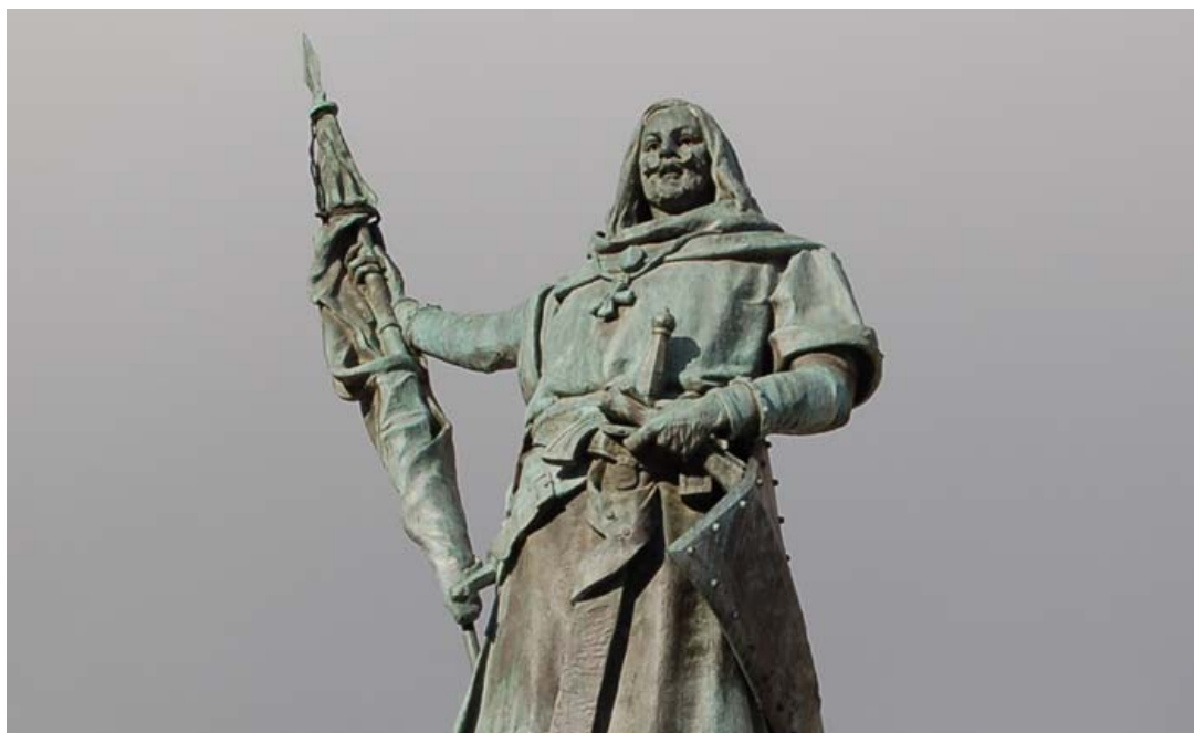
Imagen: Conde Ansúrez ( procedente de lapulgacachonda.blogspot.com ). Una película: Sans soleil , de Chris Marker, 1982. Música: Maria Rita - Pra declarar minha saudade

Tres capítulos sobre los ingresos: la aportación estatal, los impuestos y los ingresos patrimoniales.